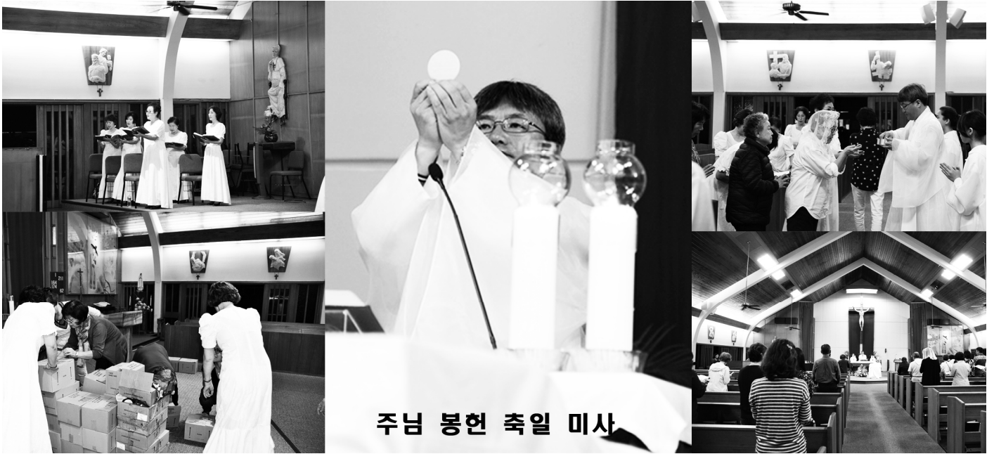
주님 봉헌 축일 미사